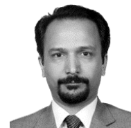
واژه باید خود باد، واژه باید خود باران باشد سهراب سپهری

افراد مختلف در رویارویی با مقوله‌ی "اصطلاح‌شناسی" در زمینه‌های تخصصی به دو گروه کلی تقسیم می‌شوند. گروه نخست با تاکید‌گذاری بر اهمیت اساسی و بنیادین این مقوله بر این باورند که استقرار و توسعه‌ی نظام اصطلاح‌شناسی اصولی و دقیق از پیش‌نیازهای توسعه‌ی هر دانش و هر زمینه‌ی تخصصی است. ولی گروه دوم یا عموماً فاقد چنین حساسیتی هستند، یا فراتر از این حس بی‌تفاوتی، مقوله‌ی اصطلاح‌شناسی را اساساً تلاشی بیهوده و تشریفاتی زائد می‌دانند.